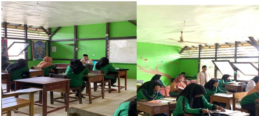
Gambar 9. Kegiatan ngajar mengajar Akidah akhlak di kelas