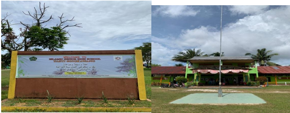
Gambar 10. Halaman Sekolah Madrasah Yasti Singkawang Tengah