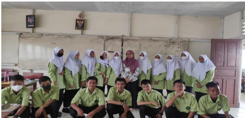
Foto Bersama Kelas XI IAI MAN 1 Pontianak