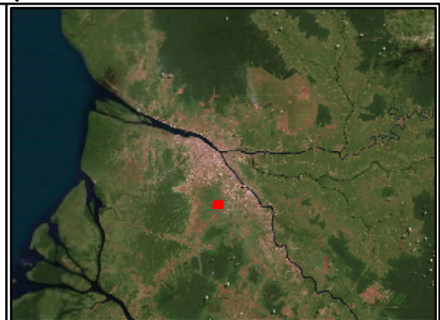
FOTO UDARA INI DIAMBIL MENGGUNAKAN : DRONE : DJI PHANTOM 4 ADVANCE 20MP KETINGGIAN : 180 METER OVERLAP : 70% JUMLAH FOTO: 86 FOTO GSD : 6.56 CM/PX TANGGAL : 29 OKTOBER 2020 NB. TIDAK DILAKUKAN KOREKSI GCP Coordinate System: WGS 1984 UTM Zone 49S Projection: Transverse Mercator Datum: WGS 1984 Units: Meter