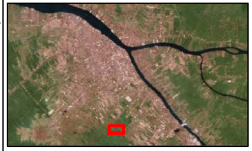
FOTO UDARA INI DIAMBIL MENGGUNAKAN : DRONE : DJI PHANTOM 4 ADVANCE 20MP KETINGGIAN : 180 METER OVERLAP : 70% JUMLAH FOTO: 131 FOTO GSD : 6.56 CM/PX TANGGAL : 29 OKTOBER 2020 NB. TIDAK DILAKUKAN KOREKSI GCP Coordinate System: WGS 1984 UTM Zone 49S Projection: Transverse Mercator Datum: WGS 1984 Units: Meter